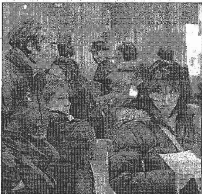
File agli sportelli. Con il progetto Tecu 140 i servizi on line per cittadini e imprese. Si tratta del più grande progetto nazionale di e-government

Abbatte tempi, costi e aumenta la competitività della pubblica amministrazione. Il punto con il ministro Stanca